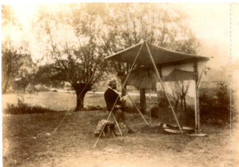
Léon Germain Pelouse Parc Naturel de la Haute Vallée de Chevreuse

De 1843 à 1900, de nombreux artistes professionnels vont se rendre par diligence de Boullay-les-Troux au relais postal des Vaux-de-Cernay. Certains logeront à Senlisse, d'autres à Cernay.