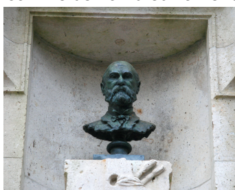
Buste de Pelouse par Falguière Parc Naturel de la Haute Vallée de Chevreuse