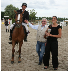
Remise des prix par les représentants des communes de Senlisse et de Rambouillet

Rendez-vous l'année prochain pour la 30 ème édition qui s'annonce encore plus festive. N'hésitez pas à nous contacter pour plus de précisions.