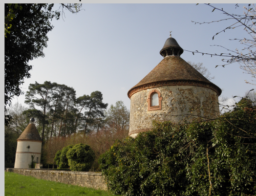
Le Château de la Cour Senlisse