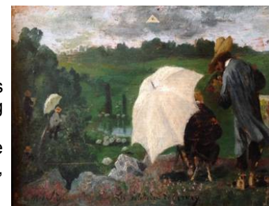
Les Solitudes de Cernay Paul Eugène Mesplès

Ainsi Paul Eugène Mesplès signe son tableau les Solitudes de Cernay. Savait-il alors qu'il l'avait peint du haut de la rue de la Châtaigneraie et qu'il aurait peut-être dû le nommer les Solitudes de Senlisse ?